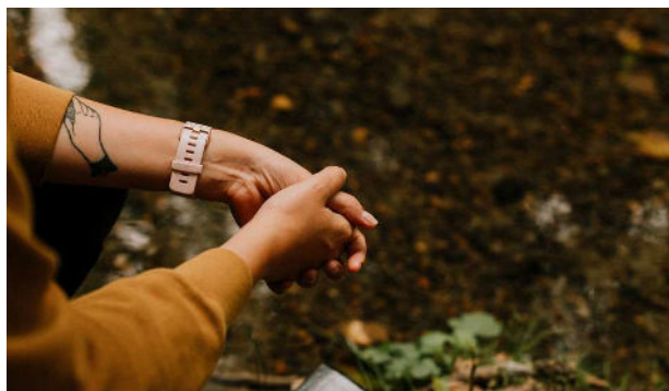
Uit: Dienstboek uitgave Protestantse Kerk in Nederland